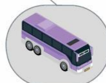
Автобус междугородного/международного следования